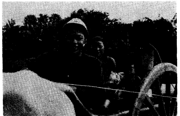
写真2 牛車に乗る少年

つぎに、社会的地位の高低を前に記した家族の諸形態と関連づけて解釈すると以下のごとくである。第9位までは、ほとんどが SFa,b,c 型および NFc 型によって占められている。これらの形態は家族周期の後半に属するものである。唯一の例外は、第6位の NFb 型であるが、世帯主が祈禱師であること、また年齢も比較的高いために、上位に評価されている。第19位以下をみると、ほとんどが NFa 型ないし NFb 型であり、これらの形態は家族周期の前半に属する。例外は第20位と24位である。2例とも、被調査者は年齢的にも比較的若く、妻の母親が存命中であるので、一家の世帯主としてまだ十分な実権をもたない。したがって、家の地位としては、さらに上位に評価されるはずであるが、被調査者自身の要因が考慮されているため、実際よりも下位に順位づけられている。中間にある第10位から第18位までについてみると、第10位、11位、12位、13位は NFa もしくは NFb に属するが、それぞれ村議、助役、祈禱師、僧歴13年という要素のために比較的高く評価されている。第14位、15位、16位、18位は SFa, b, c 型もしくは NFc 型であるけれども、それぞれ祈禱師間の対立、世帯主としての実権の弱さ、経済的地位の低さ、軽い反対感情のために、本来よりも低く評価されている。