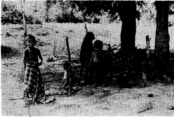
写真1 木蔭で父母を待つ子供

その判定の基準として農地所有規模が考慮されている。表1をみると、一見、農地所有規模は社会的地位の序列と関連がないように見える。しかし、第9位までの農家は、すべて、25ライ以上の農地を持っている。また第21位以下については、26位をのぞくと、部落の平均所有面積20ライを下回る農家ばかりである。この程度において、やはり、農地所有は社会的地位の序列を決定する要素になっている。