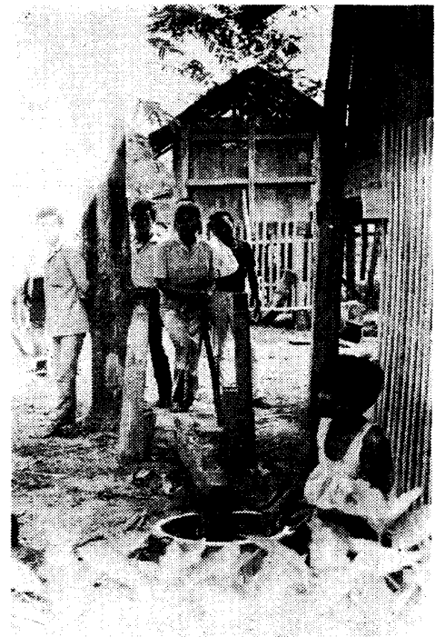
写真4 緑口に米の粉をつく娘

このように解釈すれば、ごく一般的な傾向として、社会的地位の高い家は家族周期の後半の形態に属し、農地所有規模も概して大きく、反対に、社会的地位の低い家は、だいたいにおいて、家族周期の前半の形態に属し、農地所有規模も小さいといえよう。したがって、村人の格づけ作業の背後には、この二つの要因の複合、すなわち家族生産に対する貢献度が家の社会的地位を決定する