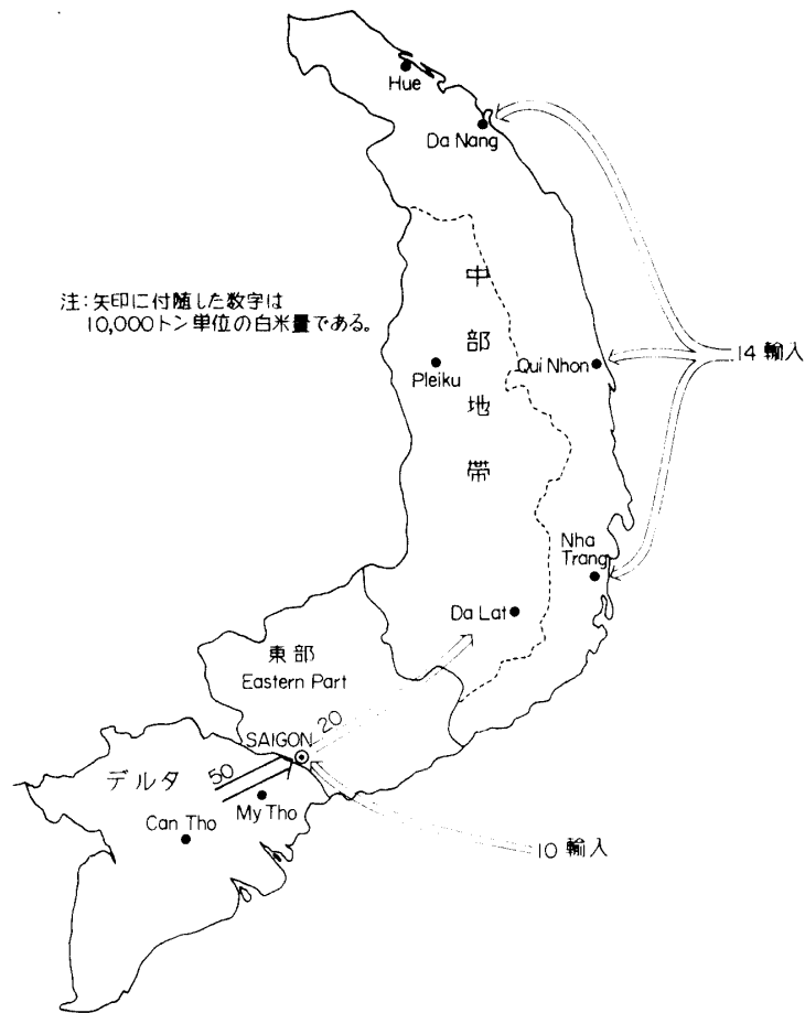
図3 南ベトナムにおける米の地理的分配 (1972)

これは疑わしい。筆者の米流通関係者の調査結果や上掲のライス・バランスに関する諸係数から、筆者は飼料利用をもみ米総生産量の約10%と推定する。また表3の生産ないし供給( X_2 )の算出過程で明らかのように、筆者の推定消費量( X_8 )は米の飼料用利用を含まないのである。では推計された消費量の偏りと水準が過大であったのは何によるのであろうか。筆者は米の国内流通データの不正確さと、人口の誤差が原因だと考える。