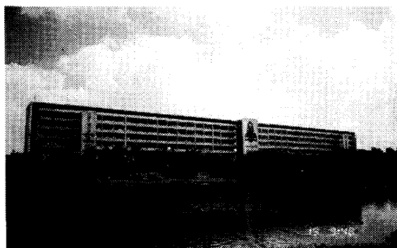
写真1 プノンペン王立大学第1キャンパス全景