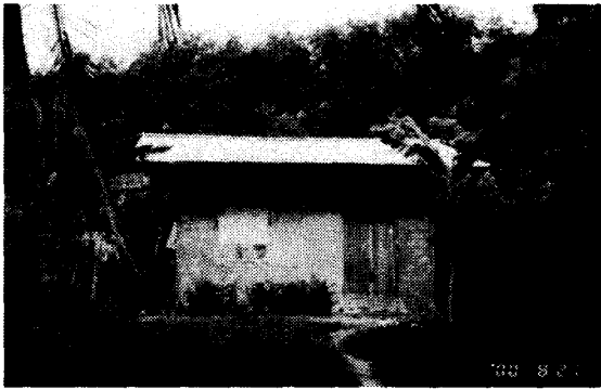
写真3 手づくりの家