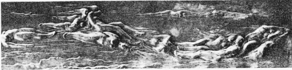
The Kyoto University Library Bulletin