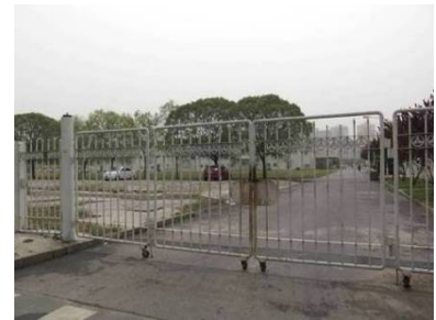
《北京・松下電子部品有限公司》