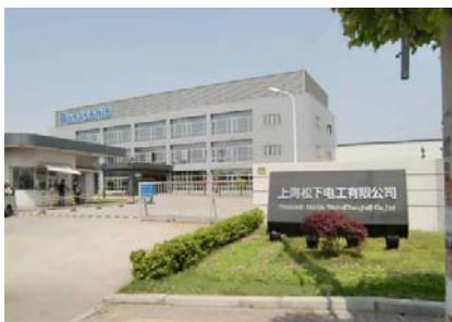
《上海松下電工有限公司》 《総経理が逃げ出したという裏門》

上記の①と②に共通することは、従業員側が公司側の総経理などを軟禁していることと、その実力行使を背景にして法定の補償額以上を要求していることなどである。ことに従業員側が労働局などに訴えるなどの合法的手段をとらず、徒党を組んで公司側の人員に危害を及ぼすような違法な実力行使が起きていることは、きわめて深刻な事態であると考えなければならない。当局側もこのような違法な実力行使を認めず、従業員側には自重をうながしているが、この傾向は中国全土で増加しつつあると考えるべきである。なお、4月末、東莞市の香港系プラスチック工場で、解雇された労働者が逆恨みして上司を殴り殺すという事件も発生した。