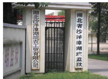
《 公司名と監獄名の看板 》

監獄はそれ自体が独立した事業体を経営していて、大型農場や綿製品製造工場、小型機械製造工場などを併設している。したがって農産物の収穫期になると受刑者が総出で働くので壮観だという。中には監獄の看板と会社の看板がいっしょに掲げられているところもあった。それらの多くの監獄に全国から面会に来る人だけでも、相当な数にのぼり、飲食店や招待所(安宿)も普通の県よりはかなり多い。監獄関係者専用カードが通用する店