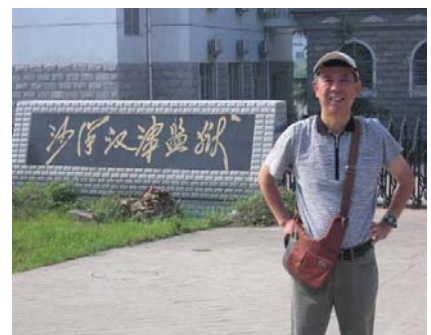
《 ある監獄前 》

沙洋県は湖北省の中央付近に位置しており、武漢空港から西北へ車で2時間半ほど走ったところにある。街の側を漢水が流れ湖も多く、付近にはのどかな田園地帯が広がっている。一見したところでは、それは中国のどこにでもある農村風景である。しかしこの県の名前を聞くと、多くの中国人は眉をひそめるという。なぜならばこの県には、中国で2番目に大きい監獄があり、さらに県の中には20か所を越える監獄が存在しているからである。なぜここに監獄が集中しているのか、その理由はわからないが、実際に道路を車で走っていると、とにかく監獄が多い。またやたらと公安や司法と書いた警察車両に出会う。ついつい脱獄が多いので巡回しているのかと思ってしまうほどであった。昼ご飯を食べているとき、地元の人にこの県の人口は60万人ぐらいだが、そのうちに監獄関連で仕事をしている人が3万7千人いるという話を聞いて、警察車両の多さにも納得した。私は中国の多くの街を見てきたが、監獄がこれだけ堂々と街中にあふれている場所はまだ初めてだった。