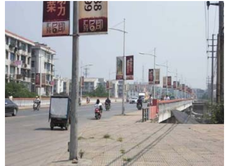
《 中江橋のたもと 》

この事件は暴動という類のものではなく、小さな抗議活動であり、おおげさに取り扱うほどのものではない。蕪湖市は大発展中で、農民工は圧倒的に不足しており、上海に出稼ぎに向かなくても十分に仕事にありつける。それが証拠にその橋のたもとにあった労働人材市場にはだれもいなかったし、市内のあちこちで求人広告が貼り出されていた。