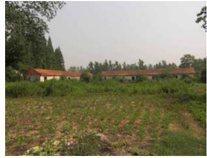
《 5・7幹部学校旧跡 》

ホテルで県の地図を見ていると、そこに「5・7幹部学校旧址」という場所があったので、従業員に聞いてみたが詳しい住所はわからなかった。とにかく近くまでいって見たがなかなかわからない。地元の老人を探して聞いてみると、現在は警察学校になっているという。そこまで行って門の前をうろうろしていると、中から老人が出てきたので聞いてみたら、この中だという。彼が気安く案内してくれたので付いて入った。そこは1966年、文化大革命の初期に毛沢東が「5・7指示」を出し、北京の幹部など約2万名を労働改造に下放した場所だという。そこには現在、なにも看板らしいものは残っておらず、ただみずぼらしい家が建っていただけだった。それでも結構多くの人が、昔をしのいで、ここに訪ねて来るという。沙洋県にはこの他にも