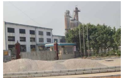
《深圳太陽管道公司の表門》