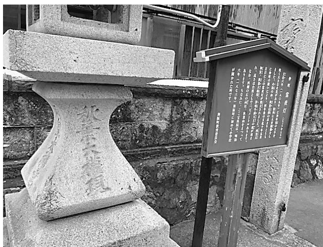
写真1 秋葉信仰を示す常夜灯の例（1813年建立）